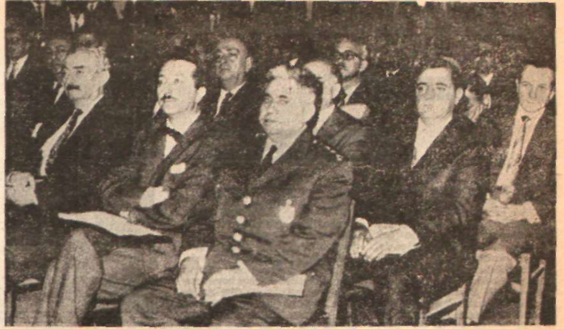
Dördüncü Çalışma Meclisine katılanlardan bir grup

İşçi ve işveren sendikaları ile, Hükümetin önem verdiği Dördüncü Çalışma Meclisi, 25 Ocak Pazartesi günü Ankara İşçi Sigortaları Kurumu binasında, Başbakanın ve Çalışma Bakanının konuşmalarıyla açıldı. Çalışma Meclisinin gündemi sadece 274 ve 275 sayılı kanunların uygulanmasında görülen aksaklıklar ve noksanlıklardan ibaret. Bu iki kanunun 1963 yılı Temmuz ayından beri uygulanması sonunda memleketimizde işçi haklarının uygulanmasında görülen aksaklıklar ve noksanlıklardan ibaret. Bu iki kanunun 1963 yılı Temmuz ayından beri uygulanması sonunda memleketimizde işçi haklarının uygulanmasında görülen aksaklıklar ve noksanlıklardan ibaret. Bu iki kanunun 1963 yılı Temmuz ayından beri uygulanması sonunda memleketimizde işçi haklarının uygulanmasında görülen aksaklıklar ve noksanlıklardan ibaret.