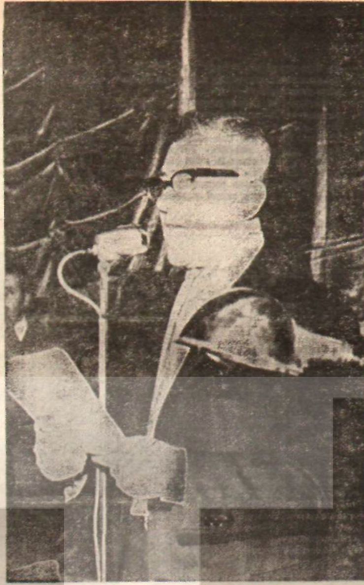
Başbakan Yardımcısı Dr. Kemal Satır «Suya götürür, susuz getirir»

Abili... Kemal abi... Bütün politikacılara da şöyle, kaldırımlar lögatların,Jan, edebiyatlarından