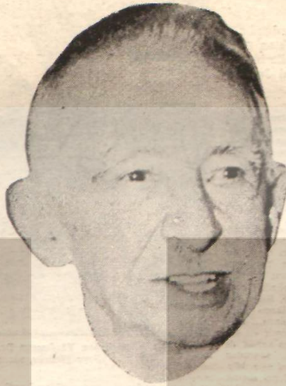
Başbakan İsmet İnönü «Petrolü kaptırdık, madenleri kurtaralım...»

Ely tasarısı, bütün topraklarımızı ve tuz harif bütün maden- lerimizi yabancı şirketlerin aramalarına açmaktadır. Ancak Ma- den Tetkik-Arama Enstitüsü, iki yıl için 100 bin hektarla sınırlı bir araziyi kendi aramaları için kapatabilecektir. Fakat M.T.A. bulduğu madeni, eşit şartlarla müzayedeye çıkarmak zorunda- dır. Madeni Etibank'a devredemez. Yabancı şirket ise, maden hakkına dayanarak yaptığı aramalarda maden bulduğu takdir-