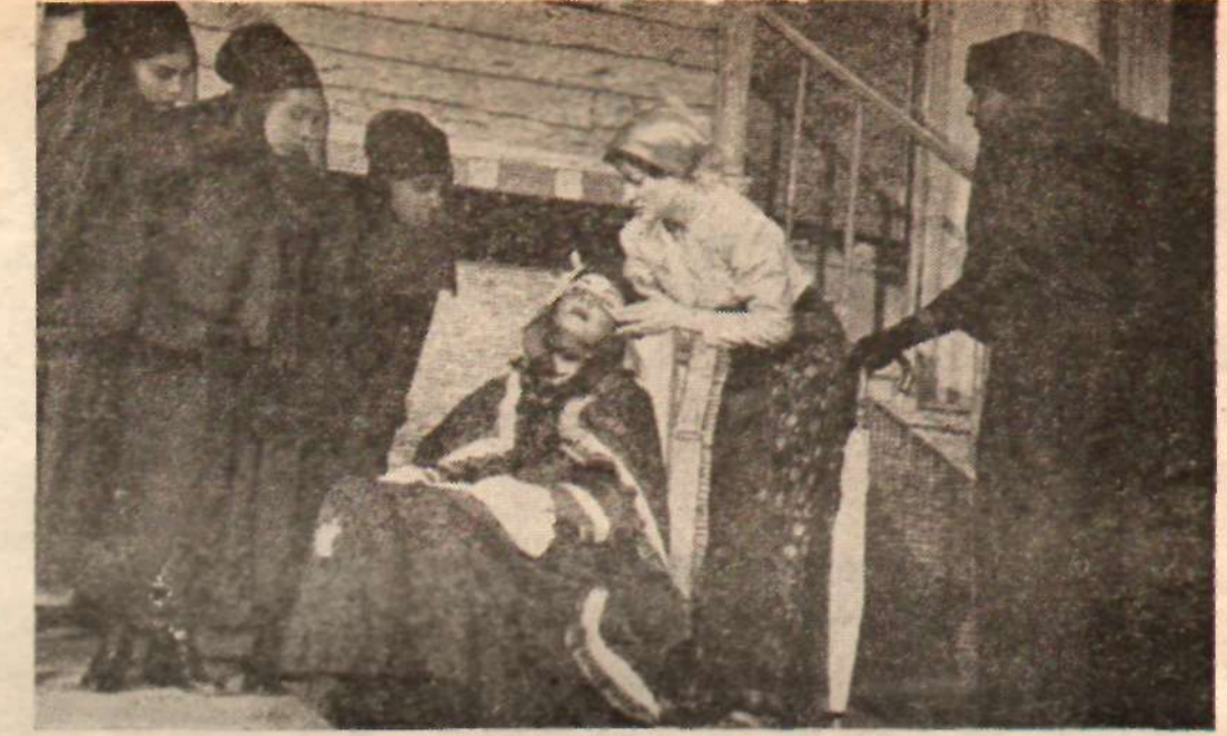
«Direkler Arasında»nın bir sahnesi İhraç malı..

«Bugün Türkiye'de terör yok. Hatta toplumumuzun ufak bir kesiminde, soyut tabir olunan zümre ile yarı aydınların kaynaştırma çevrelerinde sol düşüncenin özentili ve sulandırılması şekilleri bir çeşit moda konusu bile oluyor. (...) Sırf efenlemek için efenlemek her zaman çocukça bir davranıştır ama, kabadayılık gösterilerinin hiçbir tehlike getirmedikleri sokaklarda atılan nâralar bütünü gülünç oluyor. Unutulma-